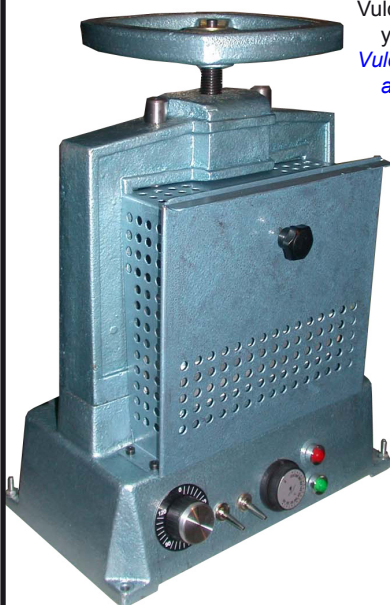
Vulcanizadora con termometro y proteccion CE Vulcanizer with thermomether and CE shield