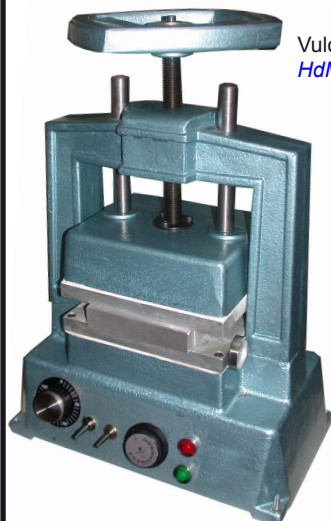
Vulcanizadora HdM con temporizador HdM Vulcanizer with timer