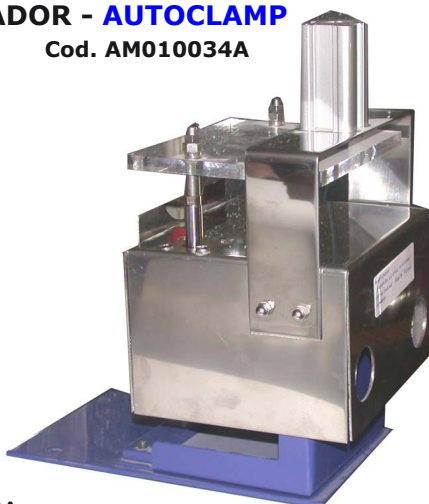
Cod. AM01003A Mordaza normal. 1 cilindro. Cauchos hasta 73 mm. largo. Normal vice. 1 piston. Moulds up to 73 mm. long.