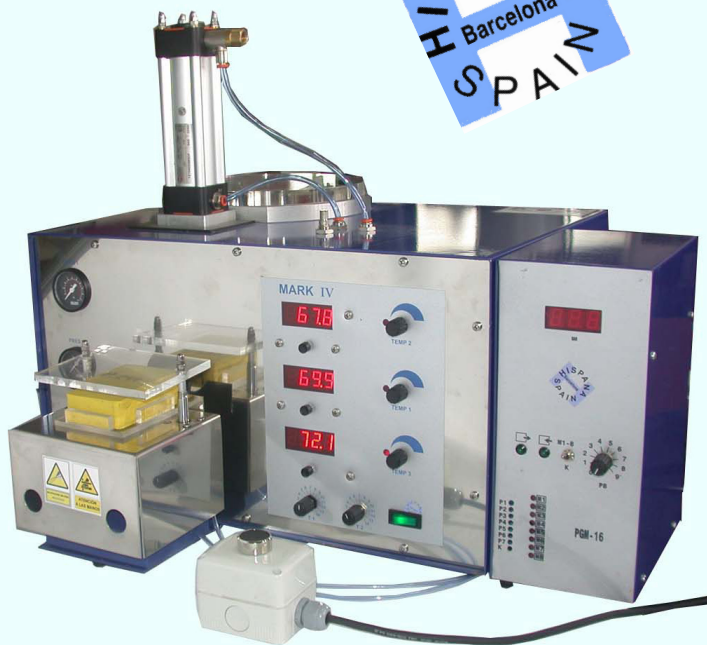
Cod. AM010034 +

Con: COD. With: Alimentador AM010034A Autoclamp Programador presión AM01004P Pressure programmer