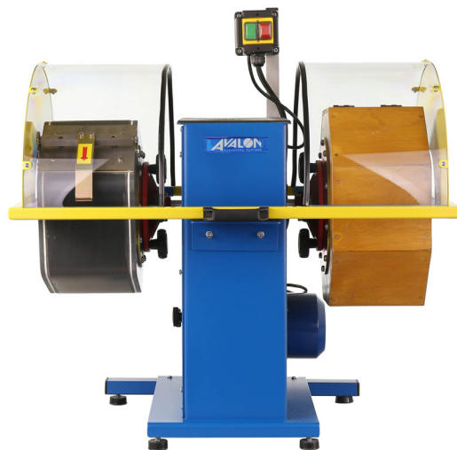
Cod. KA028070 Bombo rotativo PB2 Rotary Tumbler PB2

For grinding and polishing Processing with ceramic, plastic and porcelain chips as well as stainless steel shot