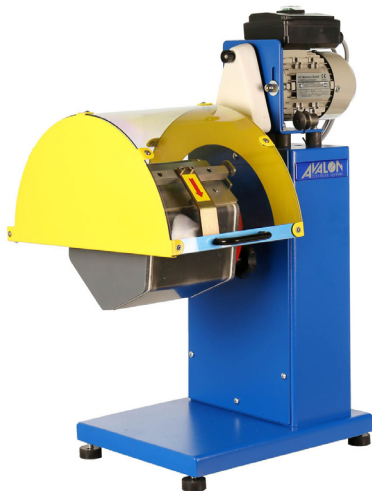
Cod. KA028050 Bombo rotativo PB1 Rotary Tumbler PB1

Para esmerilado y pulido Proceso con chips de ceramica, plastico y porcelana así como bolas de acero inoxidable