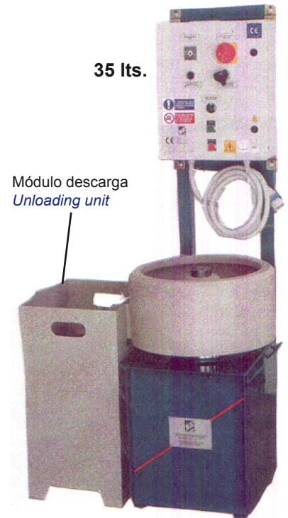
Módulo descarga Unloading unit