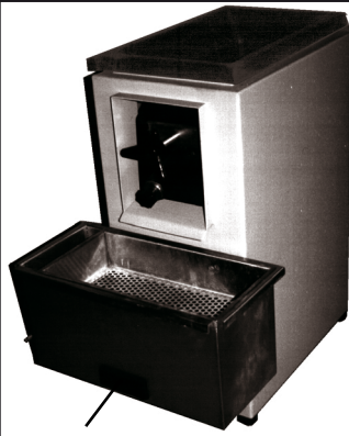
Tamizador y recogedor mesa cod. KA030142 Media collector and siever cod. KA030142

MOD. FR FR-0 I cod. KA030140 FR-0 III cod. KA030141