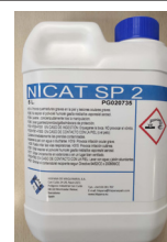
NICAT SP 2 Cod. PG020735