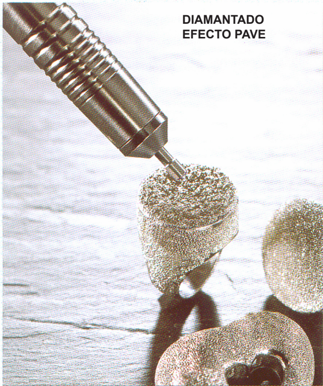
DIAMANTADO EFECTO PAVE