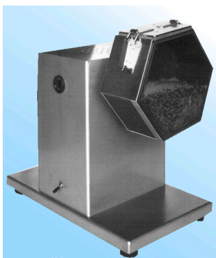
MOD. SIMPLE COD. KA030200/50

Allowing to observe the mass in movement and select the proper working mass.