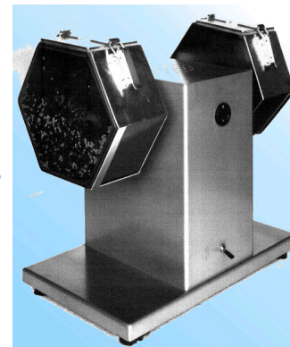
MOD. DOBLE / DOUBLE COD. KA030300

Rápido y eficiente sistema de bruñido para piezas no delicadas. Excepcional para cadenas.