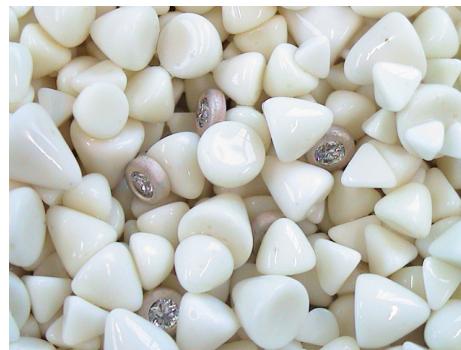
Piezas a separar de chips plásticos.

Separa la carga de un turbo de 18 lts en pocos minutos.