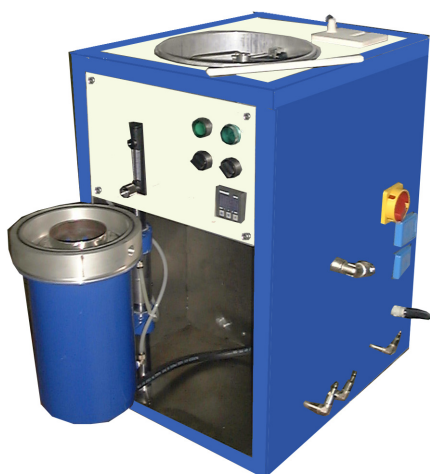
Detalle con cámara de cilindro abierta. Detail with open flask chamber

Máquina de media frecuencia para fundición e inyección de oro, plata, bronce, latón, etc... Cámara de fusión con protección de gas. Colada por vacío. Temperatura controlada a través de termopar en el interior del obturador.